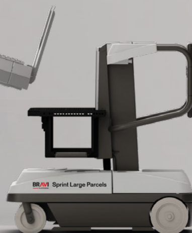
Sprint Large Parcels