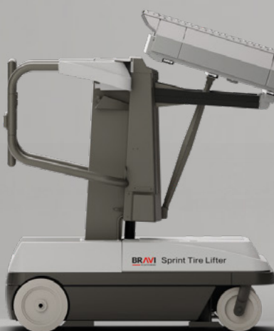
Sprint Tire Lifter